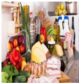
Productos Alimenticios (0,5%)