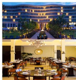
Restaurantes y Hoteles (-4,5%)