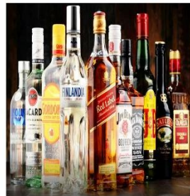
Bebidas Alcohólicas (1,5%)