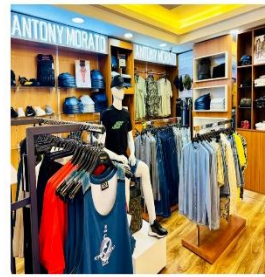
Ropa y calzado (0,1%)