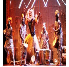
Ocio y cultura (1,3%)