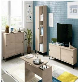
Muebles y Equipos de Hogar (0,9%)