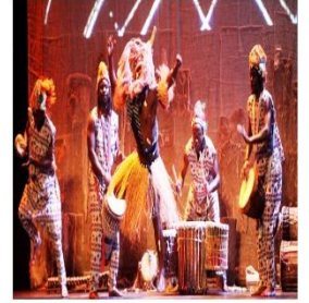
Ocio y cultura (-2,6%)