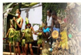
Ocio y cultura (-3,6%)