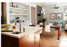
Muebles y Equipos de Hogar (0,2%)