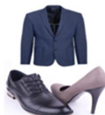
Ropa y calzado (0,2%)