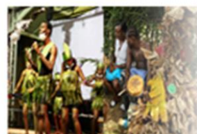
Ocio y cultura (-0,4%)