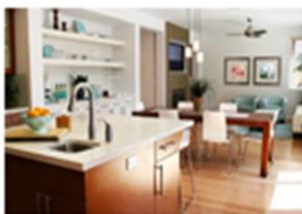
Muebles y Equipos de Hogar (0,2%)