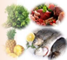
Productos Alimenticios (0,4%)