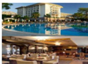
Restaurantes y Hoteles (0,2%)