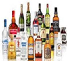
Bebidas Alcohólicas (-0,9%)