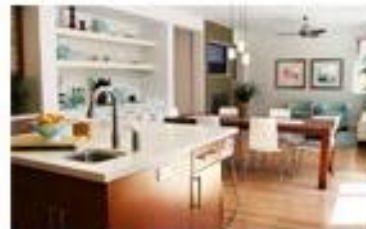
Muebles y Equipo de Hogar