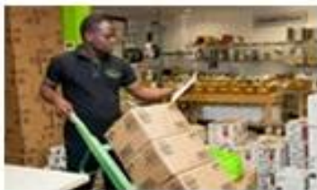
Bienes y servicios diversos